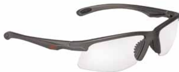
SERIE 700 LUNA CLARA