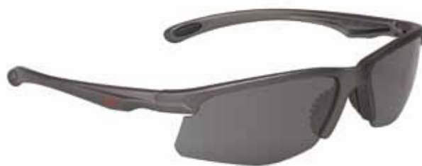
SERIE 700 LUNA OSCURA