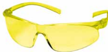
Virtua Sport Ambar

Tipo de lentes Privo Ambar Virtua Sport Ambar BX Ambar